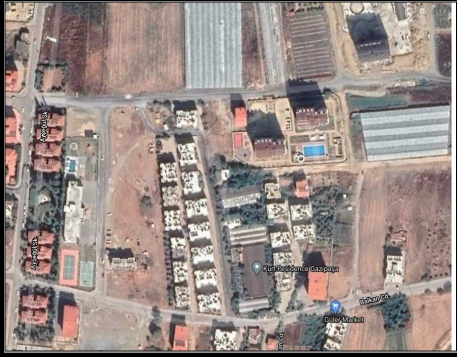
Şekil 1. Hava Fotoğrafı

Antalya İli, Gazipaşa İlçesi sınırları içerisinde Pazarcı mahallesi 20K-IIID paftasında 896 ada 01 parsel batısı park alanında trafo alanı için planda yer ayrılması amacı ile 1/1000 ölçekli Uygulama İmar Planı Değişikliği hazırlanmıştır.