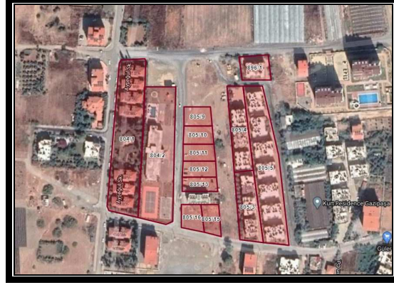
Şekil 2. Parselasyon Planı